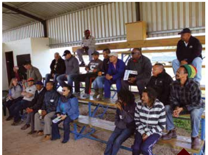
'n Speenkalf-inligtingsdag en hanteerderskursus is op 6 September 2017 aangebied. Sowat 60 studente en opkomende boere het die verrigtinge bygewoon.