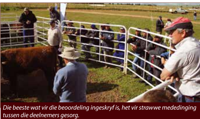
Die beeste wat vir die beoordeling ingeskryf is, het vir strawwe mededinging tussen die deelnemers gesorg.