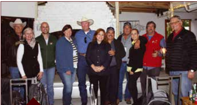
'n Gesellige groet-en-ontmoet geleentheid is op 5 September 2017 by Die Hut gehou. Talle telers en verskeie internasionale gaste het dit bygewoon en tot laat gekuier.

Nog hoogtepunte van die eeufeesvieringe was 'n groet-en-ontmoet geselligheid op 5 September, op-die-hoef beoordeling op 6 September, en 'n speenkalf-inligtingsdag en hanteerderskursus op 6 September.