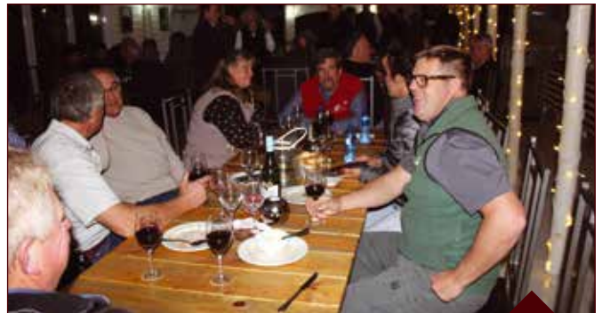
Die gaste het vir 'n smaaklike ete aangesit en heerlik saam gekuier.