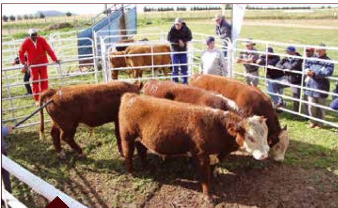
Beeste van uitstaande gehalte is by die op-die-hoef en aan-die-hak beoordeling vertoon. Die diere is ná die beoordeling na die Tomis-abattoir vervoer en geslag.